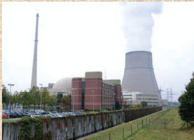
ドイツ北部にあるエムスラント原子力発電所

いずれにしろ、もう後戻りはできません。現実的な選択肢は今ある原発の運用を延長し、その間に再生可能エネルギーを柱とする次世代のエネルギー政策を確立することです。普段、ドイツは環境保全に強気ですが、洞爺湖サミットを通してちょっと弱気な一面を垣間見ました。